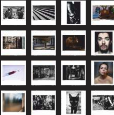
Homenatge a Oriola (2021) 16 fotografias de diferents tamaños